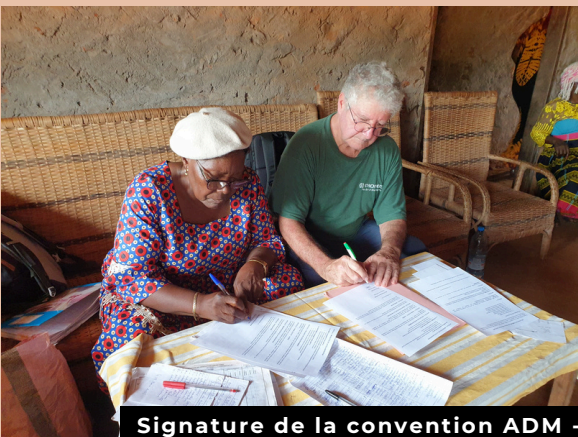
Signature de la convention ADM - GAFPAMS