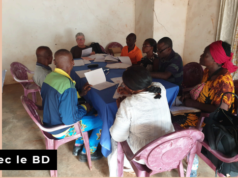
Réunion avec le BD

La mission s'est déroulée selon le programme prévu :